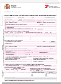
Alta de autónomos

Junto a este impreso, se adjuntará el modelo correspondiente al alta de autónomo, donde también aparecerán datos personales y de la actividad económica que se va a desarrollar.